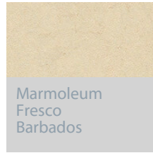
Marmoleum Fresco Barbados