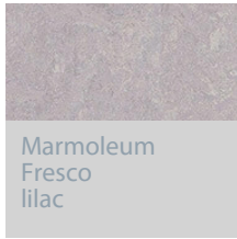
Marmoleum Fresco lilac