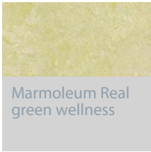
Marmoleum Real green wellness